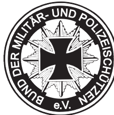
Ausbilder u. Prüfer 001